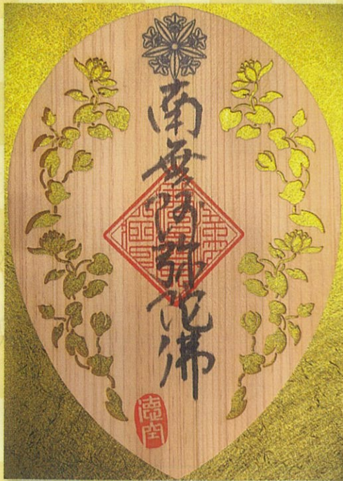
◆ 開宗850年参拝記念品 ◆