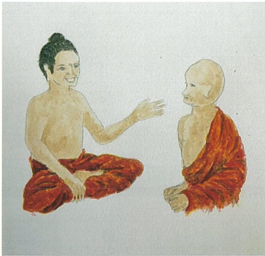
羅睺羅に語りかけるお釈迦さま