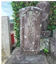
颯田弥右衛門のお墓