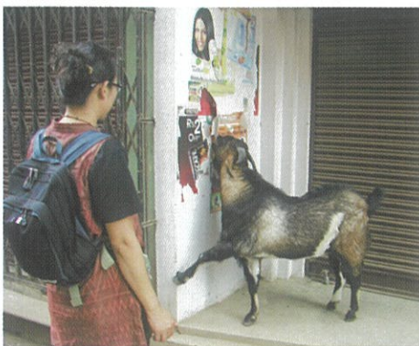
ポスターを食べる山羊 早朝のバラナシの街角で

仏教の八大聖地の内で今回訪れたのは、釈尊が覚りを開いた地、ブツダガヤ・初転法輪(初めの説法)の地、サールナート・釈尊がしばしば訪れて法を説いた『仏説観無量寿経』の舞台、ラジギールの霊鷲山(耆闍崛山)と『仏説阿彌陀経』の舞台シユラヴァステイの祇園精舎の四ヶ所、そして仏教の石窟寺院群があるアジャンタとエローラ、その他ヒンドゥー教の有名な所でカジユラホとバラナシ、アグラの避暑の観光地ナイジ・マハルや避暑の観光地ナイニタールなどだった。